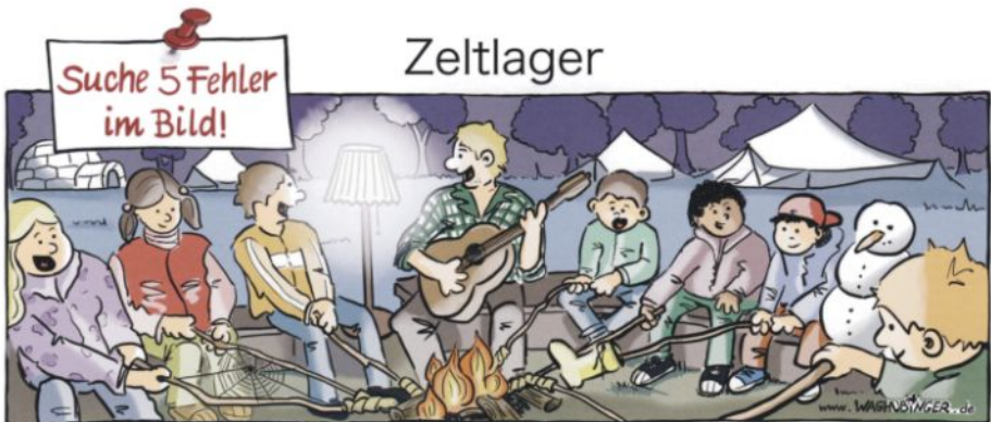
lglu, Spinnweb, Lampe, Stiefel, Schneemann

Wir laden Euch herzlich zu einem „Kleine Helden ganz groß“-Wochenende nach Westerkappeln ein. Wir werden einem kleinen